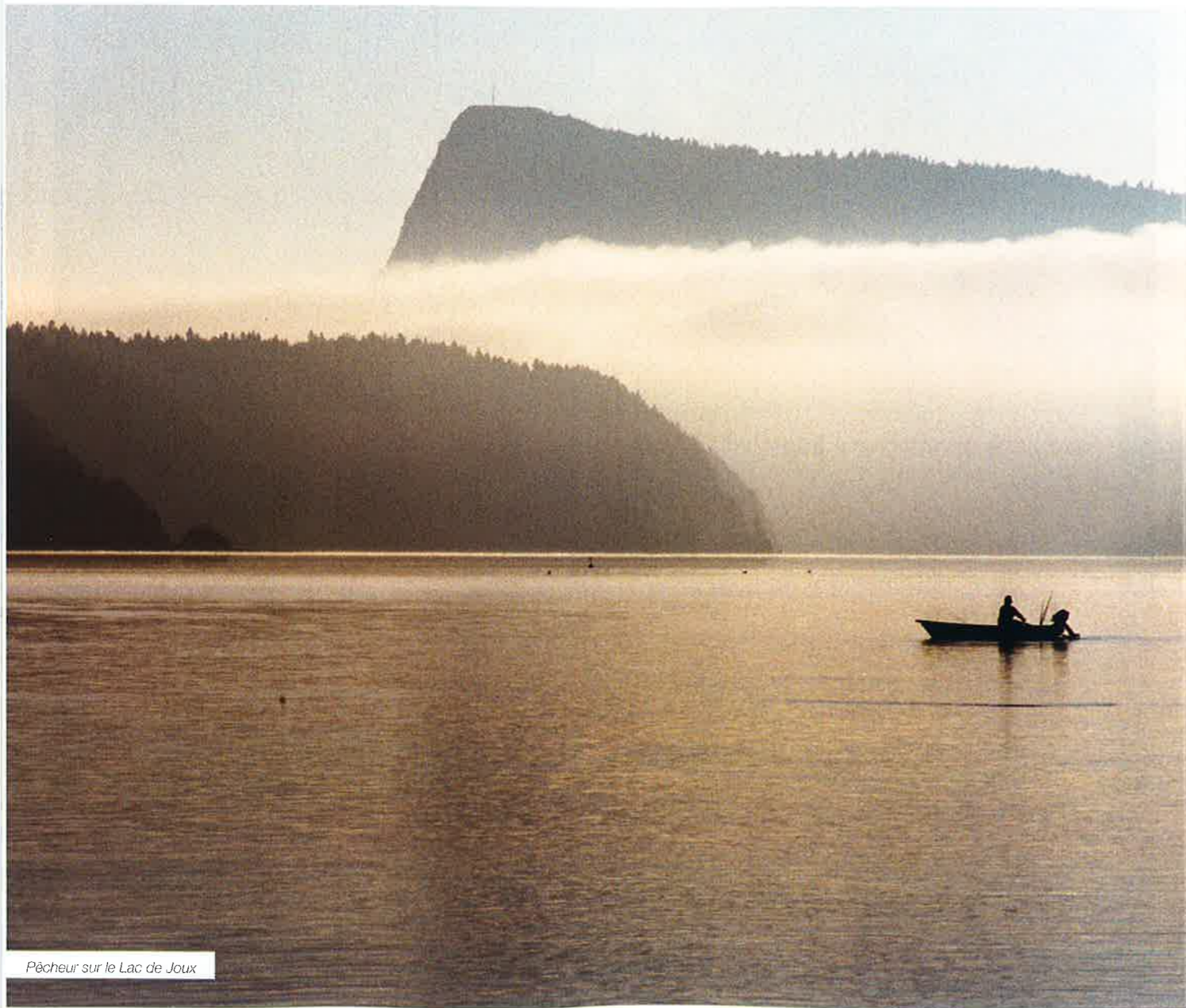
Pêcheur sur le Lac de Joux

Avec ses trois lacs de montagne, ses paysages nordiques, son accueil chaleureux et ses spécialités culinaires, la Vallée de Joux attire depuis toujours les amoureux de nature et d'authenticité.