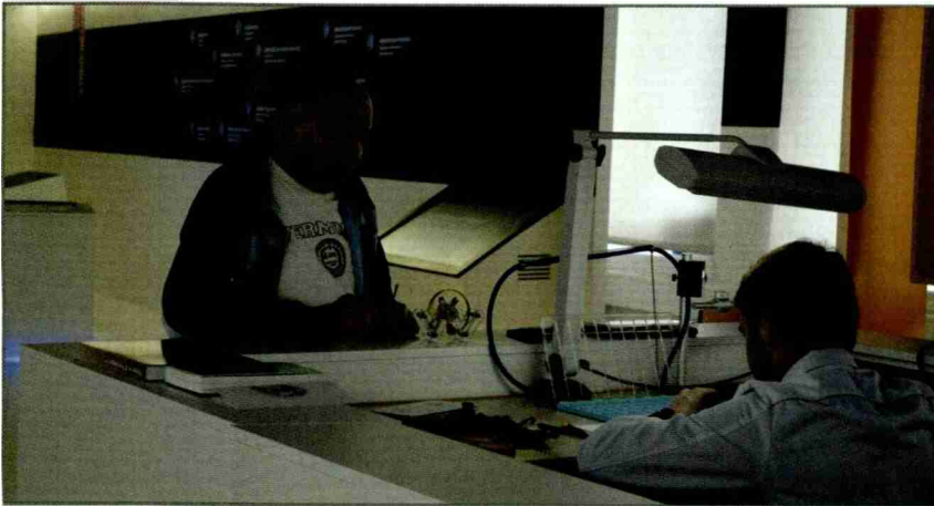
Au centre de l'exposition «Star Watch» consacrée aux grandes complications, l'Espace Horloger propose au public de rencontrer et de discuter avec des artisans du monde horloger