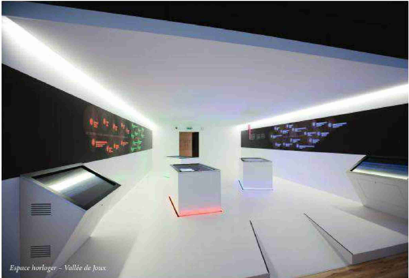
Espace horloger - Vallée de Joux

● Espace horloger - Vallée de Joux Grand-Rue 2 CH - 1347 Le Sentier Tél. +41 21 845 75 45 Email: info@espacehorloger.ch www.espacehorloger.ch