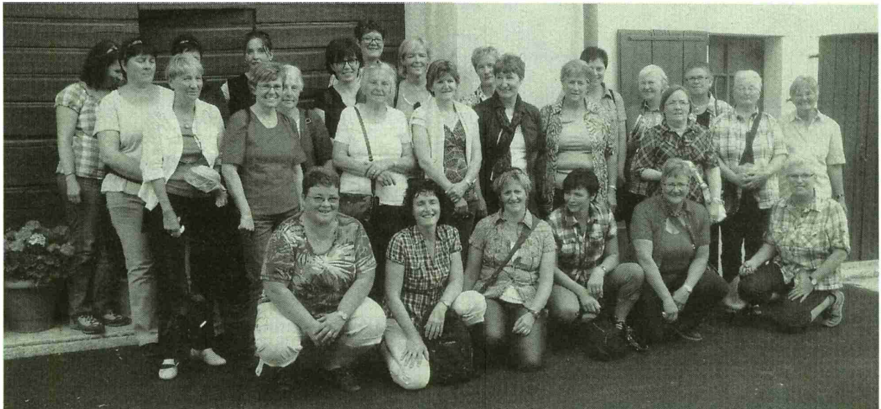
Gruppenbild der Gaiser Landfrauen auf ihrer höchst interessanten Reise.