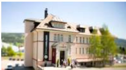
Das neue Uhrenmuseum «Espace Horloger». www.espacehorloger.ch

Seit Jahrhunderten werden im Vallée de Joux im Kanton Waadt Uhren gebaut. Einst waren es arme Bauern, die im beschaulichen Jura-Hochtal im Auftrag savoyischer Vögte an Uhrwerken werkten. Heute sind es klingende Namen von weltweit erfolgreichen Uhrwerkstätten (Audemars Piguet, Romain Gauthier), die hier ihre kostbar-komplexen Zeitmaschinen herstellen.